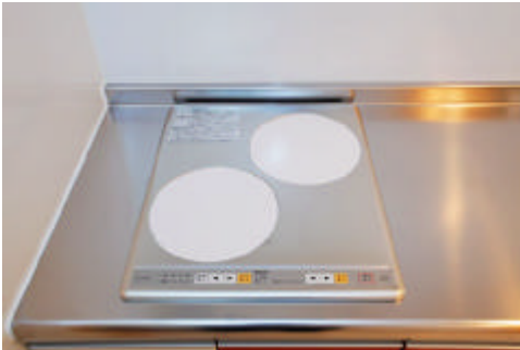
IH クッキングヒーター *実際の設置のものとは異なる場合があります