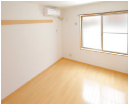
「オーネスト西新井」外観と室内