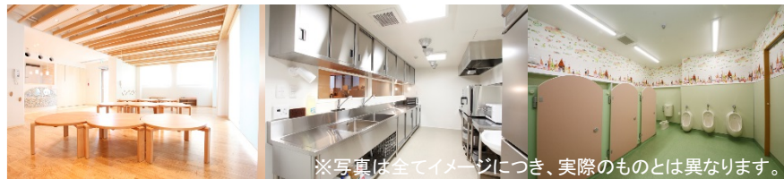
※写真は全てイメージにつき、実際のものとは異なります。

弊社スタッフによる説明が不要な方は、案内なしでもご覧いただけます。どうぞお気軽にご来場ください！