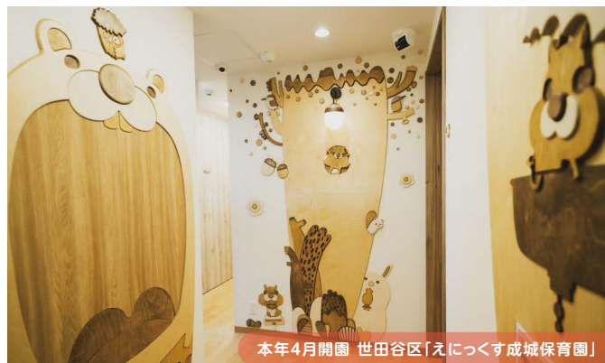
本年4月開園 世田谷区「えにつくす成城保育園」

需要が増加している保育園事業は、安定した資産活用として注目されています。マンション等既存の建物から保育園への転用も可能です。改修工事には自治体の補助金制度*もあり、竣工後は運営会社と長期の賃貸契約ができるため安心です。*条件があります