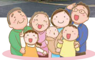
※写真はイメージにつき実際とは異なります