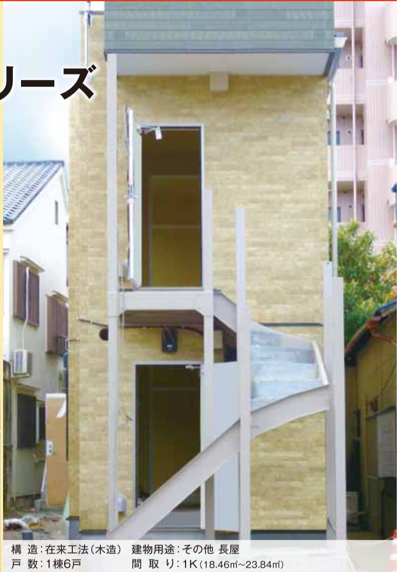
構造: 在来工法(木造) 建物用途: その他 長屋 戸数: 1棟6戸 間取り: 1K(18.46㎡~23.84㎡)