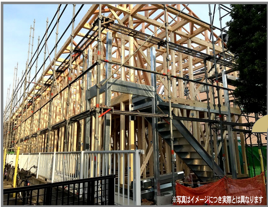
※写真はイメージにつき実際とは異なります

浦安市・市川市・江戸川区にて木造2階建てアパートを建築中! この機会に是非ともアミックスの建築現場をご覧ください!