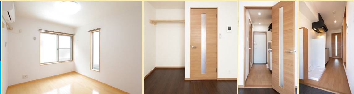
*写真はイメージにつき、実際のものとは異なります。

戸数 1棟12戸 建物用途 共同住宅 構造 在来工法(木造) 間取り 1K(21.81㎡~22.32㎡)